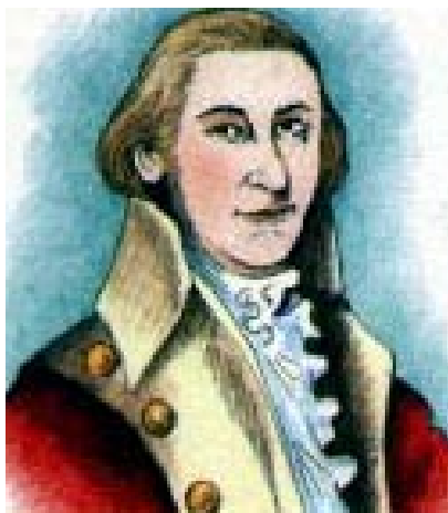
El ilustrísimo Gobernador de Puerto Rico, Don Ramón de Castro.

captura todos los puestos militares ingleses en la desembocadura del Mississippi, además de las villas fortificadas de Baton Rouge y Natchez.