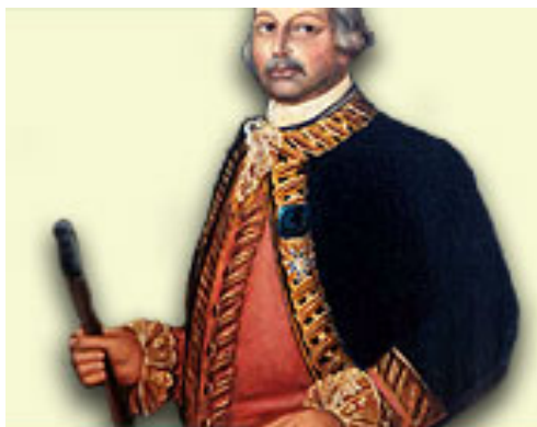
Bernardo Gálvez Gobernador de Lusiana

Spain and the American Revolution . USA: Cobblestone Publishing Co., Nov. 2000, p. 21.