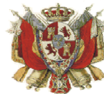
Caption describing picture or graphic.

históricos. Esta gaceta dentro de sus secciones será un foro abierto dentro del marco anacrónicamente histórico para discutir y tratar temas de suma importancia dentro de un marco conceptual de la academia y la disciplina de la Historia y las Humanidades. Donde toda información deberá estar acompañada de sus fuentes históricas o de referencias, con las cuales los lectores puedan tener la oportunidad de corroborar su veracidad o abundar en el conocimiento.