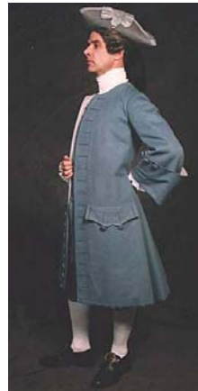
¡Telas para los más exigentes gustos!

dama pudiera desear. Telas, las más finas. Selección que incluía las más finas sedas, cotones y ruanas, sargas, creas, lienzos y bretañas. Platilla y Peldefebre entre otras tantas. En pieles, el surtido era inigualable; entre los que se contaban las más finas cordobanes hasta las muy útiles badanas. Nada de envidiarle al más moderno Mall. En esta se encontraba de todo; velas de balandras y sus respectivos