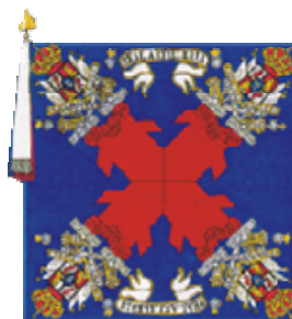
Bandera Coronela del Real Cuerpo de Artillería durante finales del siglo XVIII.

de algún conflicto; el rugido del canon. En España con la llegada al trono de Carlos III, este introduce sus famosas reformas Borbónicas, las cuales buscaban el mejorar las armas y la administración de las mismas al igual que las estrategias. Como parte